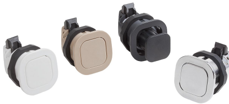
Modo de accionamiento: